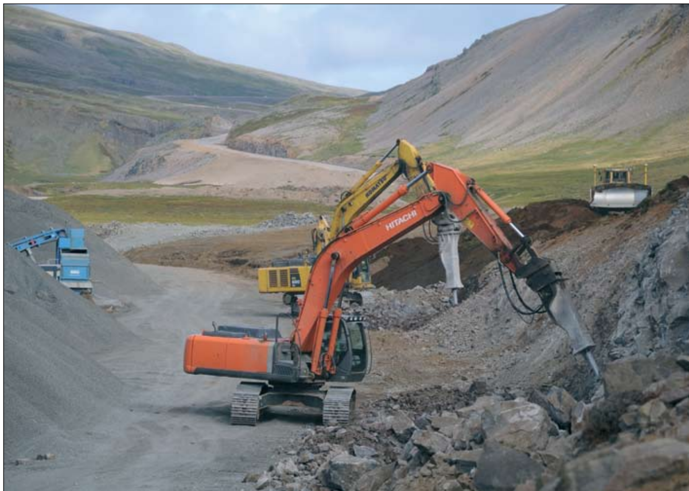
Djúpvegur (61) (Tröllatunguheiði) 2. september 2009. Unnið í skeringu.