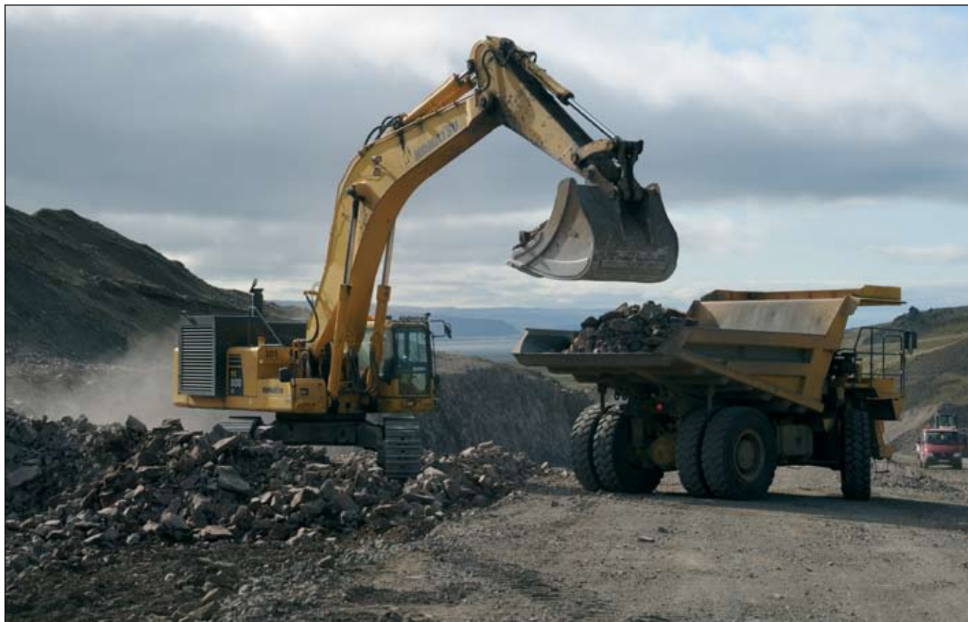
Djúpvegur (61) (Tröllatunguheiði) 2. september 2009. Efni í neðra burðarlag tekið úr skeringu.