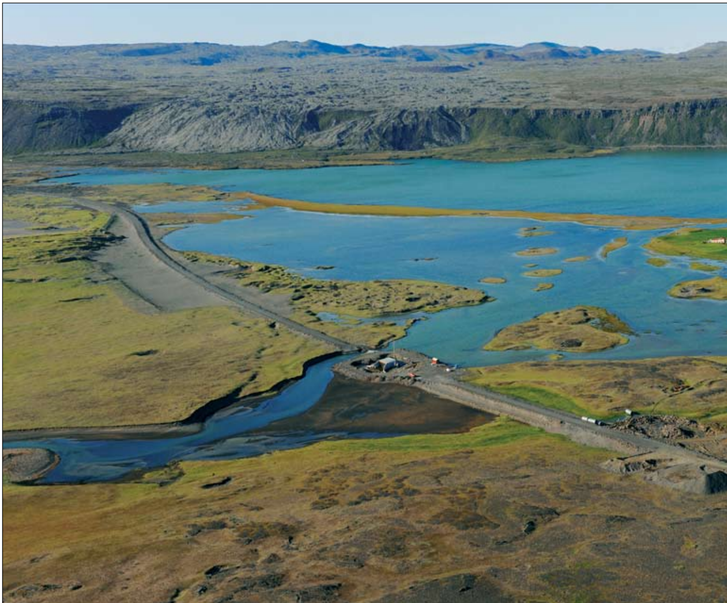
Nýr Suðurstrandarvegur. Vega- og brúargerð við Hlíðarvatn 29. ágúst 2009. Núverandi vegur liggur undir hlíðinni norðan við vatnið.