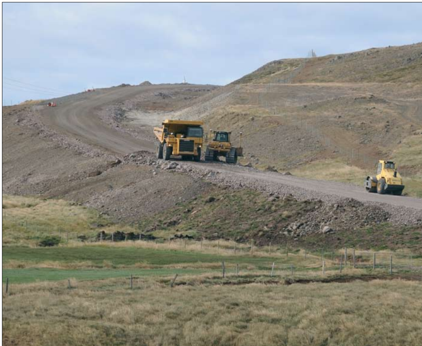
Djúpvegur (61) (Tröllatunguheiði). Framkvæmdir vestast á svæðinu 2. september 2009.