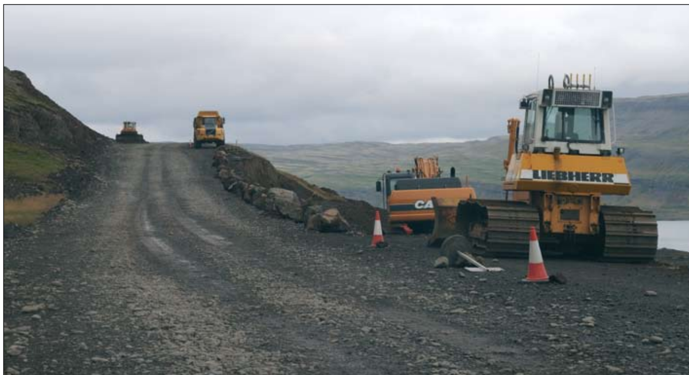
Vestfjarðavegur (60) í Kjálkafirði vestanverðum 4. september 2009..